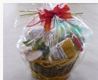
Gewürzkörbe oder Gewürzkistla ab